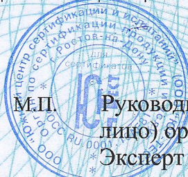
Схема сертификации 1с. Плановый инспекционный контроль не реже 1 раза в год. Разрешение на право применения знака соответствия Системы № 00871 от 30.08.2023.

М.П. Руководитель (уполномоченное лицо) органа по сертификации Эксперт